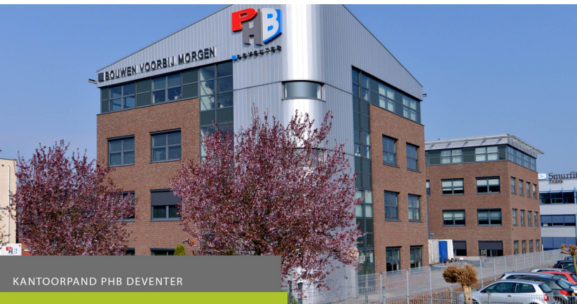
KANTOORPAND PHB DEVENTER