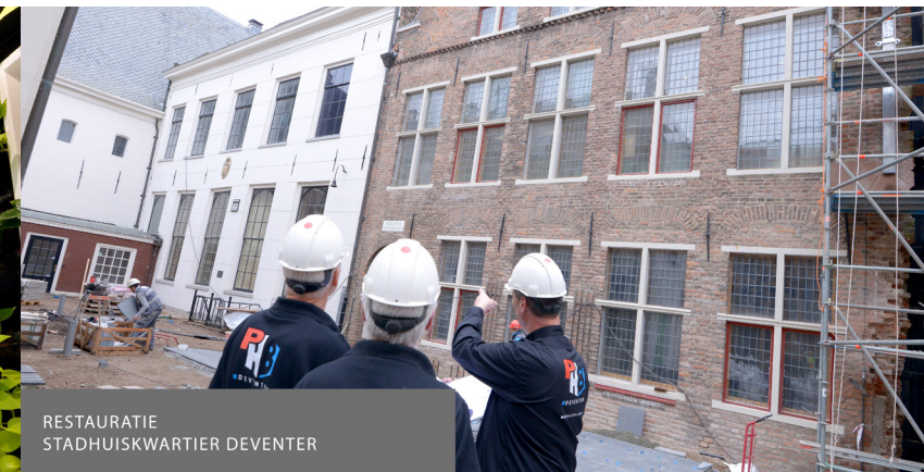
RESTAURATIE STADHUISKWARTIER DEVENTER